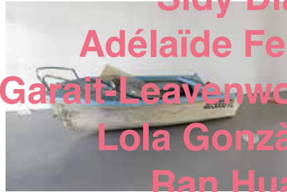
Maxime Lamarche - Le Calme après la tempête - 2014

Rathin Barman Celia-Yunior Gaëlle Choisne Ruth Cornelisse Fabrice Croux Sidy Diallo